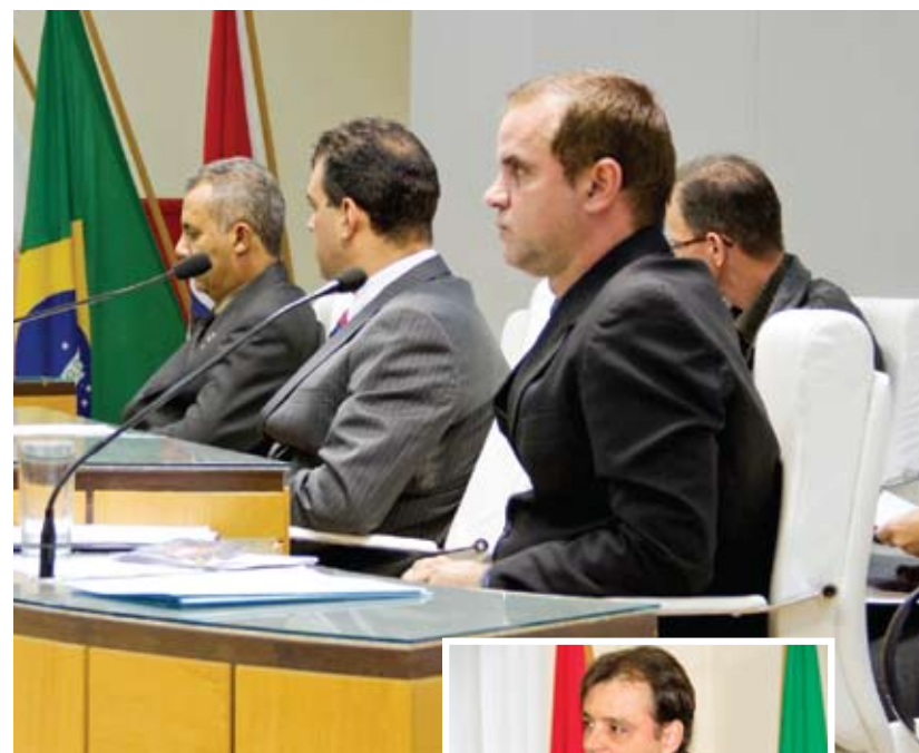
Plenário: vereadores discutem sobre projetos para bonificar servidores

Para aumentar os benefícios aos professores, os vereadores votaram e aprovaram, por unanimidade, na sessão do dia 17 de maio, projeto de Lei que retira o artigo 35 do Estatuto do Magistério, que vincula o plano de carreira ao índice geral da folha dos servidores municipais.