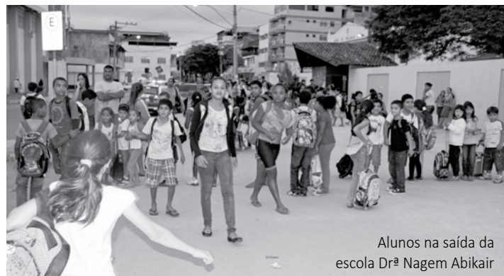
Alunos na saída da escola Drª Nagem Abikair

Outro problema narrado por mães das escolas é sobre a demora dos ônibus escolares na saída dos turnos. “Nos intervalos dos turnos da manhã e da tarde muitas crianças ficam na frente das escolas aguardando os ônibus chegarem para levá-las de volta pra casa. O problema é que elas ficam muito tempo na rua, esperando o transporte, e isso pode estar gerando essas brigas também. Solicito que a administração ajuste os horários de saída dos transportes para que as crianças não fiquem tanto tempo na rua”, analisou o vereador, que recebeu cartas de mães que narraram esses problemas.