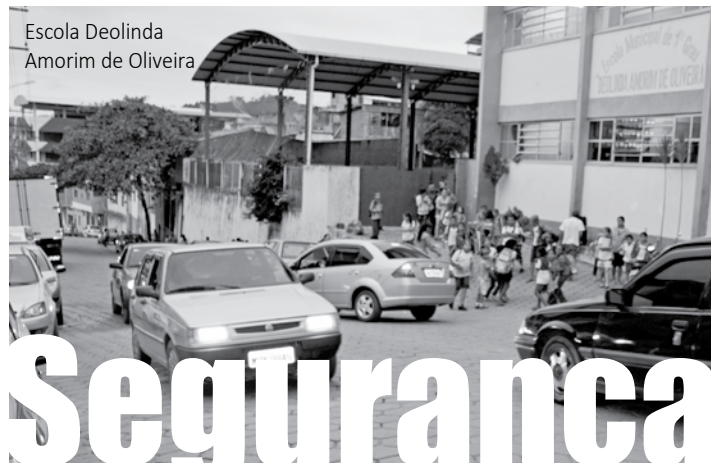
Escola Deolinda Amorim de Oliveira