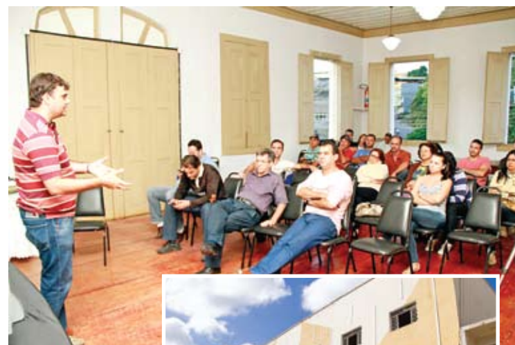
Vereadores acompanharam audiência pública sobre as mudanças na estrutura da Prefeitura