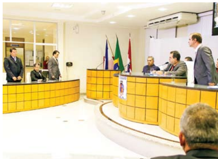
Mesa Diretora acompanhou as discussões sobre os projetos em pauta

Na última sessão da Câmara, do dia 18 de junho, os vereadores também aprovaram o projeto de Lei que altera o relatório de Programa e Ações por órgão e o quadro de detalhamento de despesas do PPA – Plano Plurianual para o quadriênio 2014/2017.