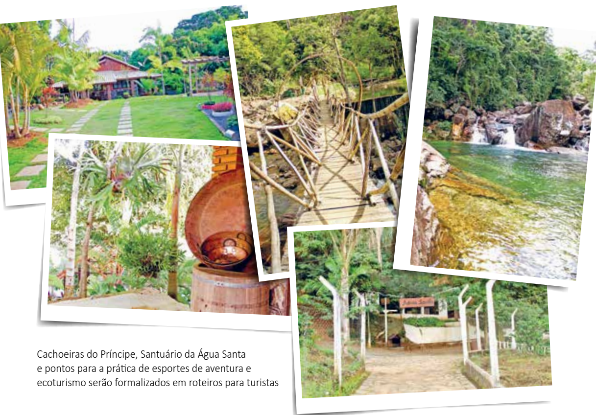
Cachoeiras do Príncipe, Santuário da Água Santa e pontos para a prática de esportes de aventura e ecoturismo serão formalizados em roteiros para turistas