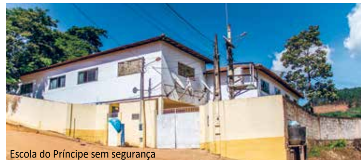
Escola do Príncipe sem segurança