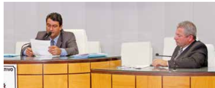
A aprovação do projeto aconteceu em sessão extraordinária, sob opiniões divergentes

Além disso, os parlamentares comentaram que a administração não conta com uma secretaria de Meio Ambiente estruturada, com engenheiro, técnicos e fiscais para que possam emitir laudos e fiscalizar os empreendimentos. Os vereadores realiza-