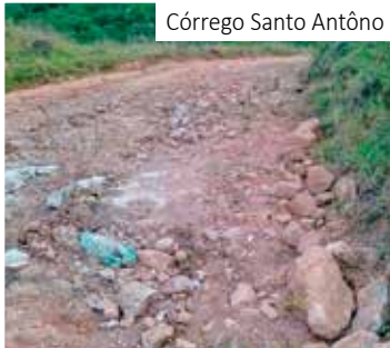
Córrego Santo Antônio