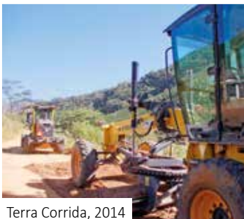
Terra Corrida, 2014