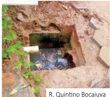
R. Quintino Bocaiuva