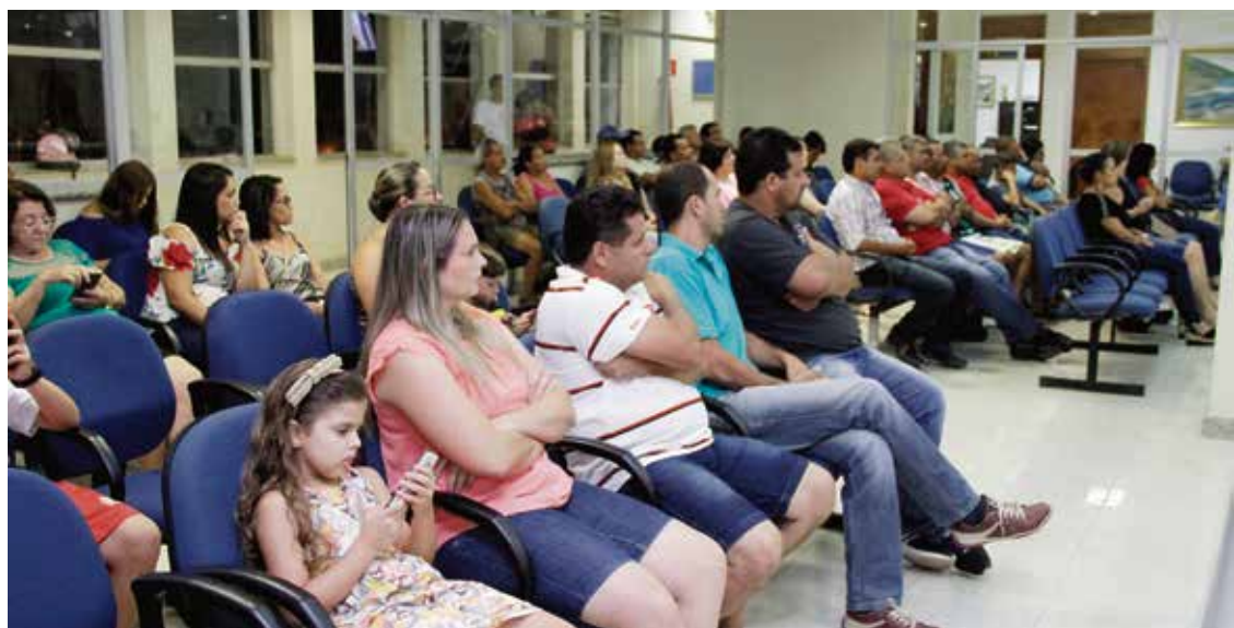
Servidores municipais acompanham as cobranças dos parlamentares para que Executivo encaminhe projeto de Lei