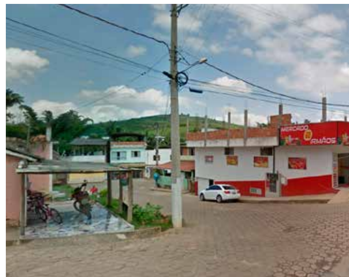
Moradores de Nossa Ssenhora das Graças questionam valor do projeto para capela mortuária diante de demandas que têm mais prioridade